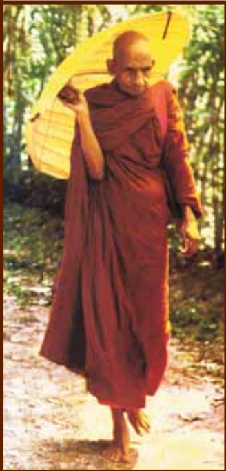
අභිගරු පුප්‍රණීය රාජකීය පණ්ඨිත කඩවැද්දීමේ ශ්‍රී ජිනවංශාභිධාන මහෝපාධ්‍යය මා හිමියන්

ලංකාවට ආරණ්‍යක ප්‍රතිපත්තියක් අවශ්‍ය යයි වටහාගත් අතිපූජ්‍ය අභිගනවන්තේ මා හිමියන් වහන්සේ වර්ෂ 1882 දී එකී මා හිමියන් වහන්සේ ප්‍රමුඛ ස්වාමීන් වහන්සේලා කීප නමක් රාජ්‍ය අනුග්‍රහයෙන් බුරුම (මියන්මාර්) රටට වැඩම කොට එහිදී රාජ්‍ය අනුග්‍රහයෙන් රාමැක්කු දේශයේදී පැවිදි උපසම්පදාව ලබා එම රටේදී අධ්‍යාපනය වශයෙන් ගත යුතු සියල්ල කළ පිටිතයට සම්බන්ධ කොට රාජ්‍ය අනුග්‍රහයෙන් එකී සභා පිවිස ලංකා බුද්ධාගමයට නවත් ගත්තියත්, ඔයෙන් දිවේ අවයෙන් ශ්‍රී ලංකාවට වැඩම කොට 1884 දී ශ්‍රී ලංකා රාමැක්කු මහා නිකාය පිහිට වූහ. අතිපූජ්‍ය අභිගනවන්තේ ඉන්ද්‍රසභවර ඤාණසාමී නැමැති මා හිමියන් වහන්සේ ප්‍රථම මහා නායක පදවියට පත්වූහ. එතැන් පටන් මෙම මහා නිකායේ මහා නායක මා හිමියන් වහන්සේලා 11 නමක් මේ වන විට පාලනය කර ඇත.